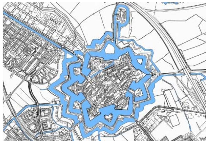
Vaarwater rond Naarden anno 2005