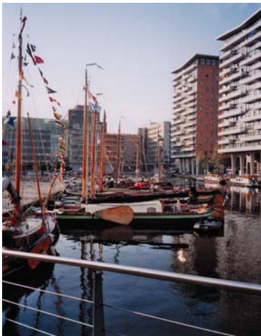
Beurtgat: 100 jaar binnenhavens

kansen voor historische schepen ontstaan er misschien ook voor het zogenaamde beurtgat, het water tussen de Haagse Hogeschool en de Fijnjekade waar vroeger de beurtschepen lagen. Zij verbonden Den Haag met vele andere havens in Nederland. Dit beurtgat blijkt een prachtige plek voor kleinere historische schepen als bijvoorbeeld