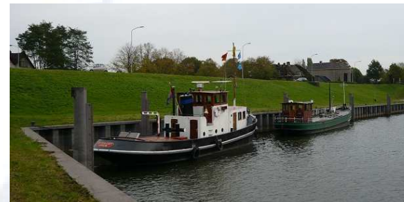
Nieuwe locatie: Wageningen

Nu het initiatief van de Schepencarrousel begint te lopen gaat de bekendheid ervan als een lopend vuurtje door Nederland. Ligplaatseigenaren en schippers uit andere delen van het land nemen contact op met Stichting Er-varen of er ook mogelijkheden zijn op 'hun' locatie. Wij zijn blij met deze ontwikkeling, het is ook de bedoeling dat de Schepencarrousel uiteindelijk landelijk gaat opereren. Dit is ook de beste manier om de roulatie optimaal op gang te brengen en de schippers het beste te kunnen bieden. Het op gang brengen en houden van de Schepencarrousel is veel organisatie werk, de stichting Er-varen wil dan ook een (landelijke) organisatie bieden om dit mogelijk te maken. Om het systeem beheersbaar te maken wordt gedacht om het beheer in regio's te doen. Dit betekent dat er voor schepen die in een bepaalde regio willen rouleren een soort 'abonnement' geregeld wordt over een aantal ligplaatsen. De meeste schippers zijn toch aan een bepaalde regio gebonden. Door het hele land rouleren blijft natuurlijk ook altijd mogelijk.