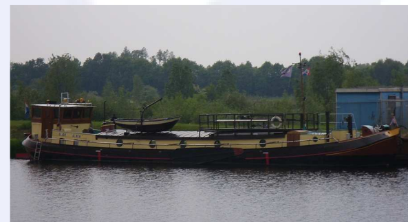
Nieuw schip: de Oljor