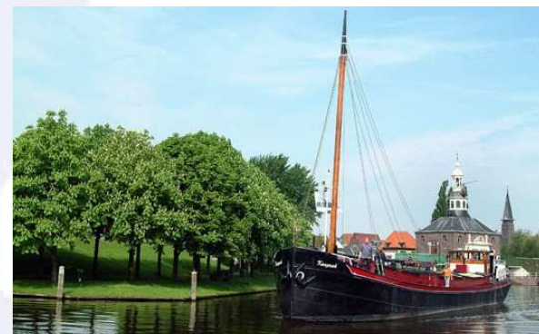
Nieuw schip: de luxe motor Knapzak