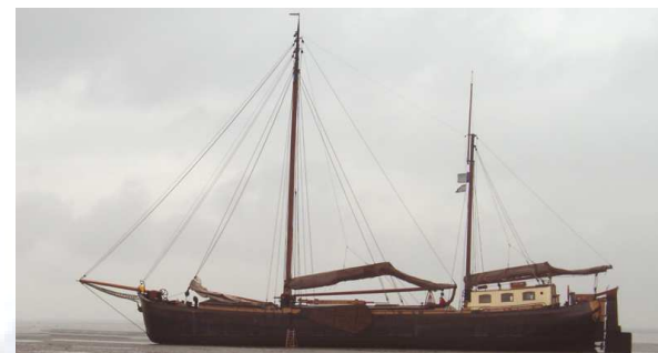
Nieuw schip: de klipperaak Tatanka

Steunt u ons initiatief en wilt u donateur worden? Maak dan 30 euro over op bankrekeningnummer 10.67.53.444 t.n.v. Stichting Er-varen Arnhem, o.v.v. 'donateur' en stuur een mail met uw adresgegevens naar flessenpost@schepencarrousel.nl