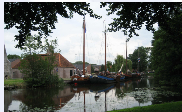
Nieuwe locatie: Hasselt (Ov.)