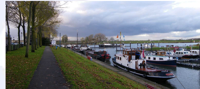
Nieuwe locatie: Culemborg