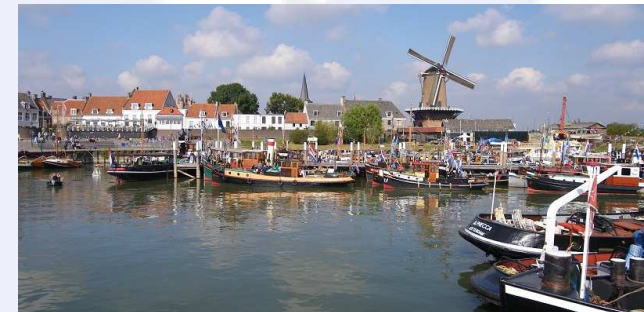
Nieuwe locatie: Wijk bij Duurstede