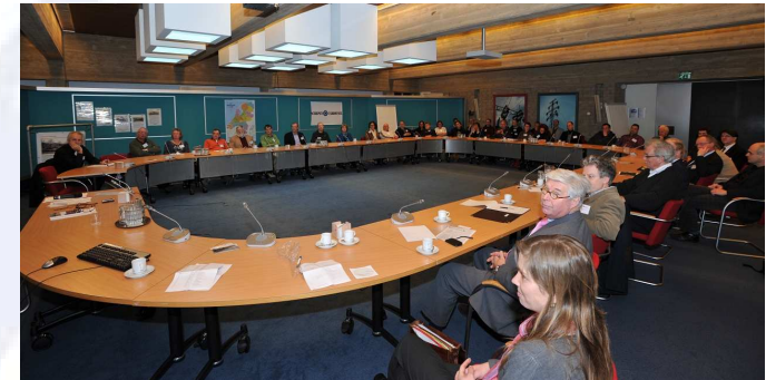
Impressie van de aanwezigen op het symposium

De Schepencarrousel is een systeem waarbinnen schepen uitgewisseld kunnen worden tussen ligplaatsen. De schepen liggen voor een korte periode (ca. 3 maanden) op een ligplaats. Op de ligplaats presenteren de schepen het verhaal van het schip en de cultuurhistorie van de scheepvaart. Van het schip wordt verteld waar en waarom het gebouwd is, wat het zoal heeft beleefd in de loop van de tijd en waarom bepaalde aanpassingen gedaan zijn. Voor meer informatie verwijzen wij u naar onze website www.schepencarrousel.nl