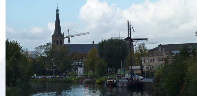
Nieuwe locatie: Doetinchem

Last but not least hebben we een zeer mooie locatie in Overijssel aangesloten: Hasselt . Er kunnen hier schepen van de Schepencarrousel liggen aan de kade en bij de kalkovens. Mocht u met uw schip op een van deze locaties willen liggen neem dan contact op met de organisatie van Stichting Er-varen: flessenpost@schepencarrousel.nl of 06-18553663